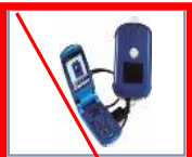
第3弾 2006年2月 (終売)