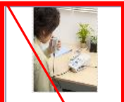
第6弾 2010年1月 (終売)