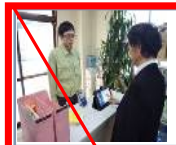
第11弾 2013年2月 (終売)