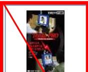
第4弾 2008年2月 (終売)