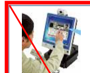
第7弾 2011年5月 (終売)