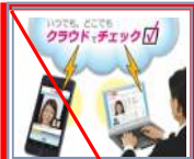
第13弾 2014年4月 (終売)