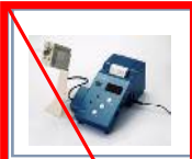
第2弾 2004年12月 (終売)